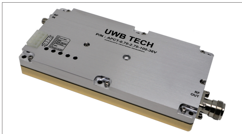
▲ Рис. 1. Внешний вид твердотельного усилителя APCT-0.70-2.70-100-36V

В настоящее время компания производит усилители, работающие в непрерывном режиме на уровне мощности до 200 Вт в частотном диапазоне до 6 ГГц с полосой пропускания до 4 ГГц. Помимо широкополосных усилителей в линейке компании имеются узкополосные усилители мощности с максимальной частотой 2,5 ГГц и выходной мощностью до 50 Вт. Планируется, что в 2018 г. компания анонсирует импульсный усили-